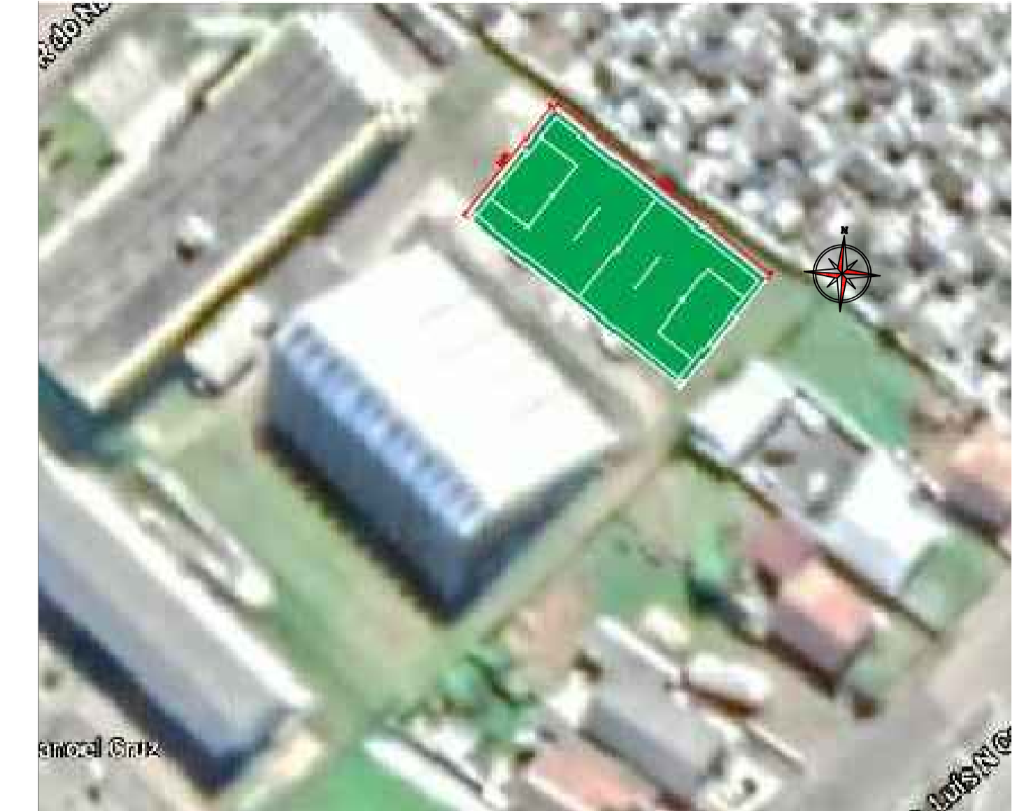
LOCALIZAÇÃO Google Maps sem escala