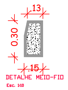
DETALHE MEIO-FIO Esc. 1:10